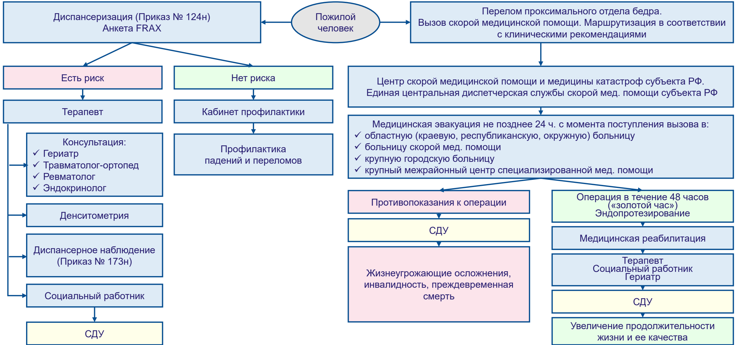
Схема действия комплекса мер по профилактике падений и переломов